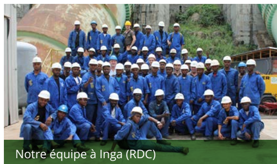
Notre équipe à Inga (RDC)

Notre force réside dans la présence combinée d'ingénieurs et de chefs de projets, tant en Europe qu'en Afrique.